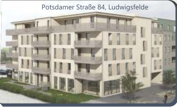
Potsdamer Straße 84, Ludwigsfelde